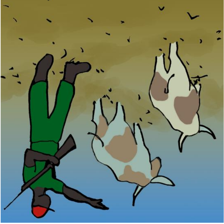
ତାଙ୍କ ଶକ୍ତତା ଲାଞ୍ଜିତ ହେଲା ।