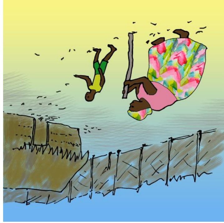
ତାଙ୍କ ସୁଖିନିତା ଫଳ ହିସାବ ହେଲା ।